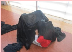
色をついた布と白い布を使って「冬眠遊び」をしました。冬眠している動物ややらない動物に子ども達はなりきり布の中に隠れたり、雪に見立てた白い布をかぶせたりと楽しんでいました。(年長組)