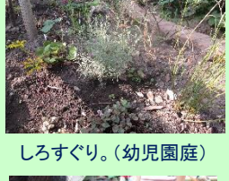
しろすぐり。(幼児園庭)