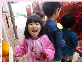
絵の具遊び楽しい！(年中組)