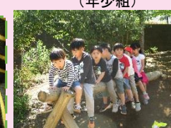
新緑に恵まれた園庭の一本橋に登ったり、地面にはたくさんのダンゴ虫やミミズ等。探索、たのしい。(年中・少組)