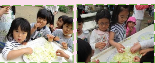
「美味しいね」(幼児クラス)