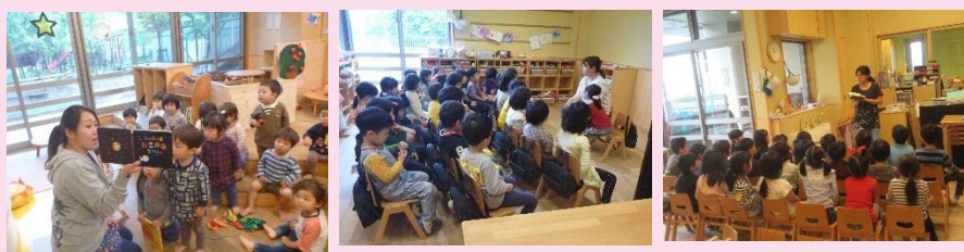
絵本を通して子ども達と分かち合いました。(乳児クラス)