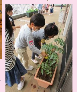
絵本を読み始めると「トマトだ！」「だって葉がギザギザ」「きゅうりは丸いでしょ」と。子ども達は去年植えたきゅうりの葉を覚えていたり、トマトの葉の特徴も知っていたり。その後、みんなでトマトを植えました。(年中組)