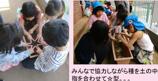
みんなで協力しながら種を土の中へ。指を合わせて☆型。。