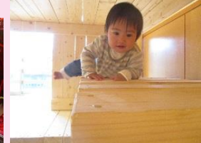
室内探索。ロフトを見つけすかさずハイハイで。(乳児クラス)