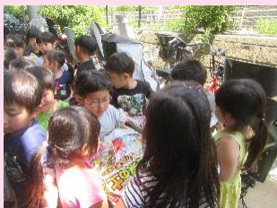
みんなで土を運び、プランターへ。