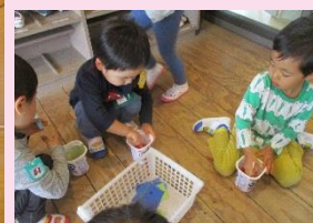
お花紙を水の中に入れてグルグル回すと不思議な現象が。。。(年少組)