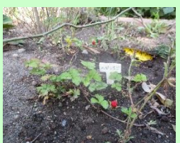
へびいちご。(幼児園庭)