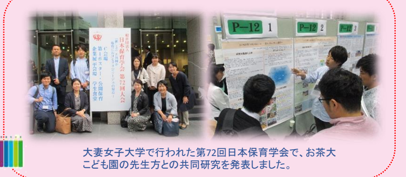
大妻女子大学で行われた第72回日本保育学会で、お茶大こども園の先生方との共同研究を発表しました。

晴天に恵まれた5月10日、海の公園に親子遠足に行きました。乳児クラスから年長組までの子どもたちと保護者の方々・先生たちが参加して、学年やクラス毎にスキップやゲームなどして楽しい時間を過ごしました。普段なかなか顔を合わせることが出来ない方々とも一緒にお話したり、お弁当を頂くなど、良い交流がもてたのではないのでしょうか。子どもたちの表情もとても楽しそうに終始喜びに溢れていましたね。