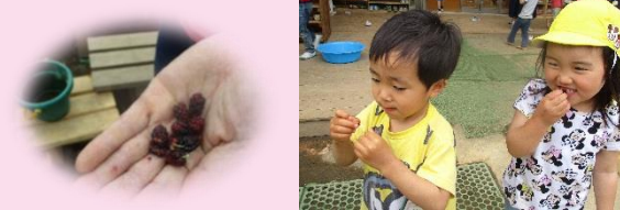
初めて食べたクワの実。美味しい(乳児クラス)