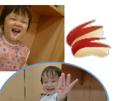
美味しい給食いただきます。自分で食べる事が嬉しいんです。 (乳児クラス)