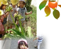
かまきりさんと遭遇。(乳児クラス)