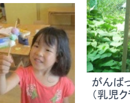
色を混ぜてオリジナル色水の完成 (年中組)