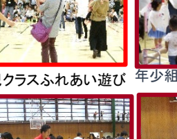
年長組かけっこ 真剣です