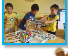
遊びや生活の中から