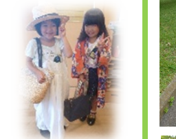
「お兄さんにしてるのかなあ」とじっくり観察(乳児クラス)