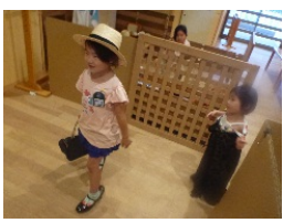
おしゃれコーナーが新設され変身を楽しんでいます (年少・年中・年長組)