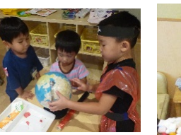
お料理たくさんできたよ (年中組)