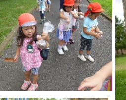
ロケット公園へのお散歩。木登り得意だよ(年少組)