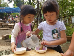
お庭で見つけたお花で色水作り(年少組)