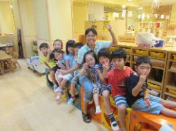
箱をつなげて電車になったよ (年中組)