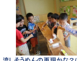
流しそうめんの再現かな?(年長組)