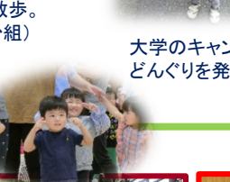
体操「じゃんけんレンジャー」