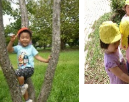
大学のキャンパス内でお花やどんぐりを発見。(乳児クラス)