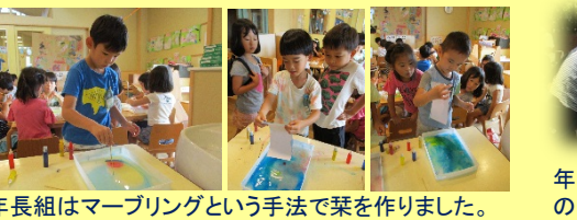
年長組はマーブリングという手法で葉を作りました。