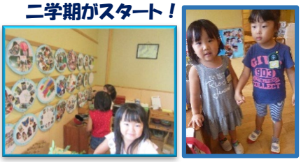
二学期がスタート! お友達はどんな夏を過ごしたのかな、それぞれのクラスで子ども達がみんなの「思い出シート」をじっくり眺めていました(年少・年中・年長組)