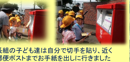
年長組の子ども達は自分で切手を貼り、近くの郵便ポストまでお手紙を出しに行きました