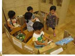
手作り車でレッツゴー! (年少組)