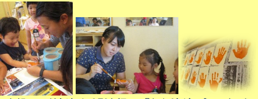
年少組の子ども達は手型を押して『お'手'がみ』にしました

12日、郵便局の方がボスロボットと一緒にこども園に来て下さいました。乳児クラス、年少組、年中組の子ども達は、郵便局の方が用意して下さいました郵便車にお手紙を入れ、「おじいちゃん、おばあちゃんに届けて下さい!」とボスロボットにお願いしました。