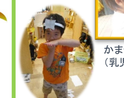
忍法手裏剣の術(年中組)