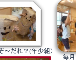
年少組 おばけにへ〜んしん!