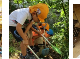
地球儀を見ながら「これはどこかなあ」 (年中・年長組)