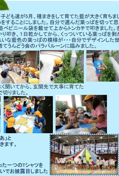
世界でたった一つのTシャツをうんどうかいでお披露目しました