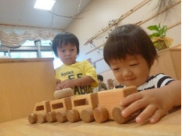
つなげてつなげて(乳児クラス)